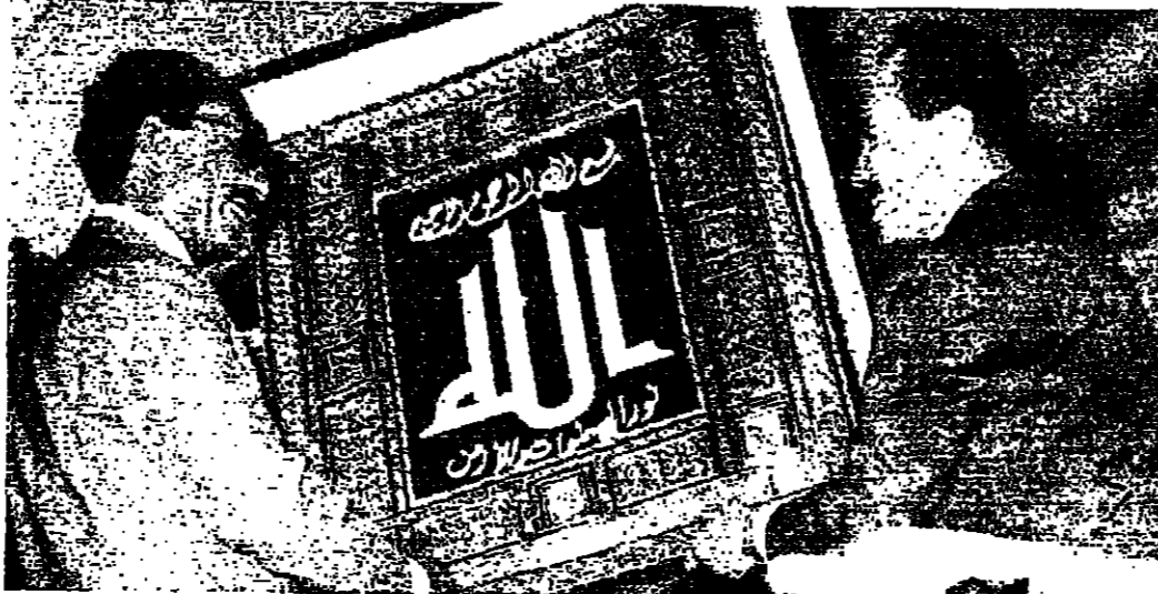
خلال الاحتفال في أسبوط